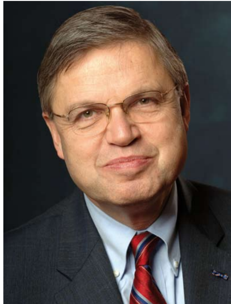
MINISTER HIRSCH BALLIN

overlastgevende gedrag van hun kinderen. Kortom: ook aan het terugdringen van overlast en verloedering wordt hard gewerkt. Maar het duurt iets langer voordat al deze maatregelen in werking zijn getreden en het gewenste effect gaan sorteren.'